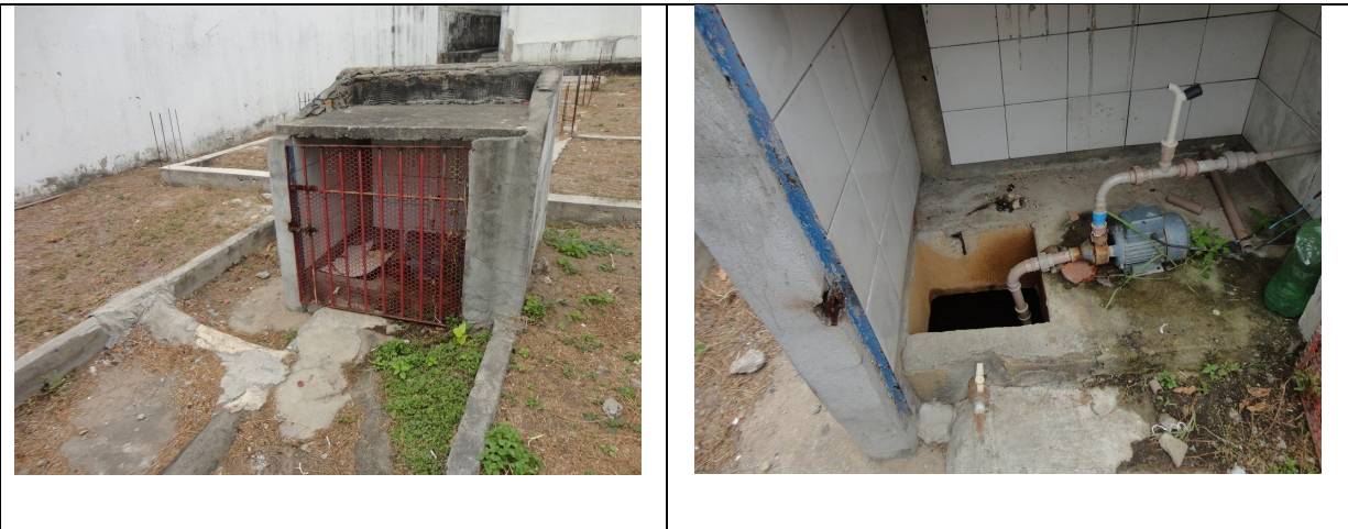
Casa da bomba e acesso ao poço, respectivamente.

Outro problema referente à qualidade da água refere-se aos constantes vazamentos de esgoto, que ocorrem em áreas próximas ao poço. Dessa forma pode haver também contaminação da água do poço.