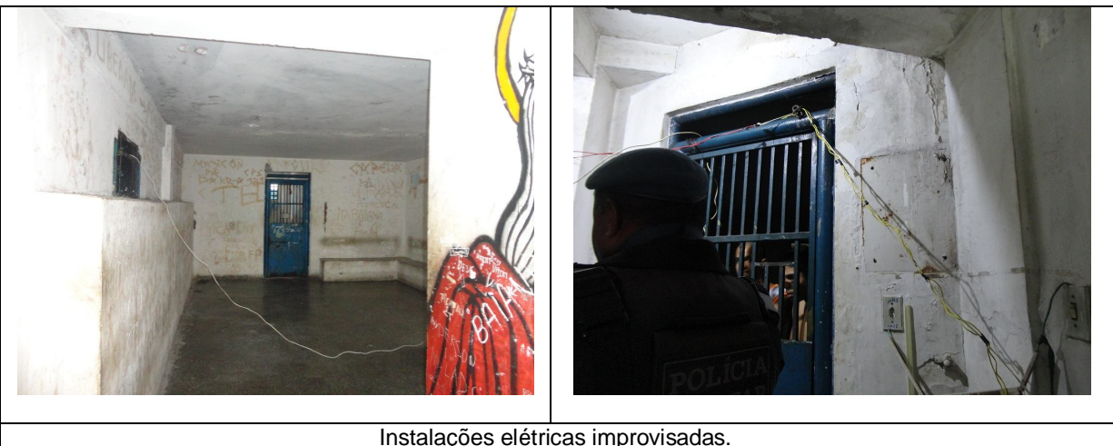
Instalações elétricas improvisadas.

e) Precariedade das instalações hidrossanitárias