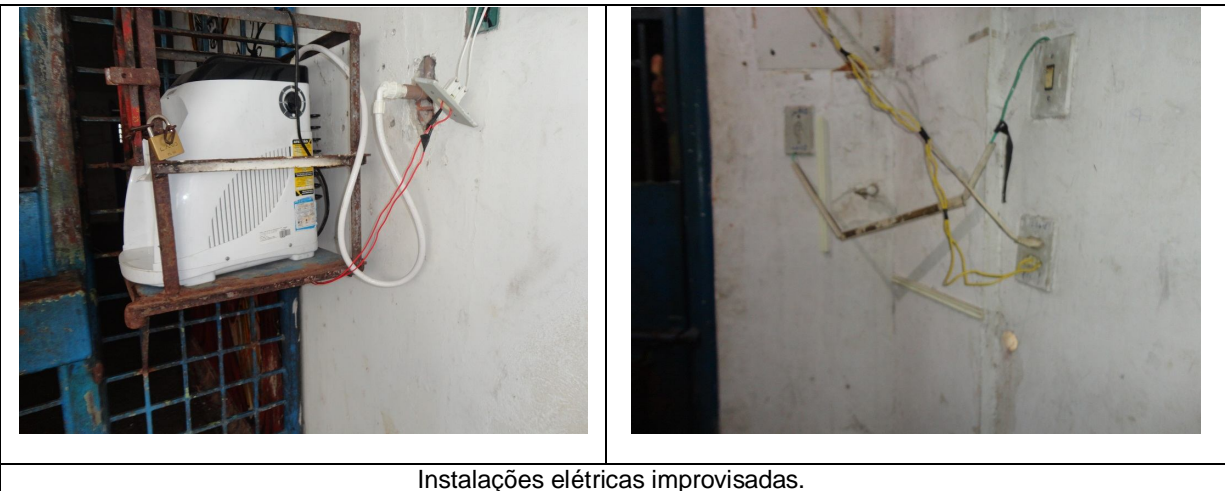
Instalações elétricas improvisadas.

Ao longo da edificação é notória a precariedade das instalações elétricas, onde é possível identificar instalações elétricas improvisadas. Esta situação necessita de intervenção urgente, pois representa risco de choque elétrico ou até mesmo incêndios;