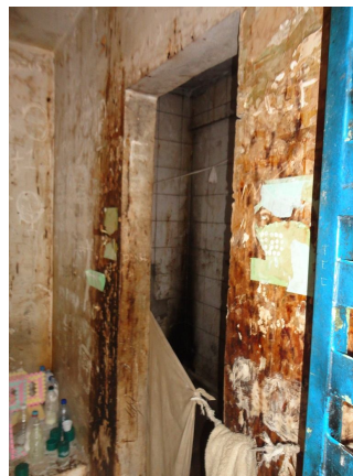
Condições inadequadas do quarto improvisado próximo à sala da equipe técnica.