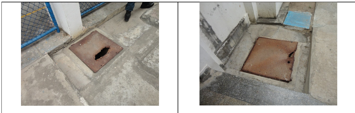
Tampas metálicas oxidadas, que oferecem risco de queda aos transeuntes.

Vale citar, que no caso específico das tampas, este material já não apresenta condições de suportar o peso de pessoas transitando, e, portanto, representa risco de queda para os transeuntes;