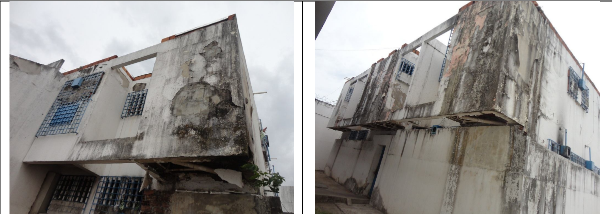
Danos no forro, causados por vazamentos nas instalações sanitárias.

localizados no pavimento superior. Além disso, o vazamento externo facilita o contato indevido e contaminante com os efluentes que escorrem nas áreas de circulação próximas;